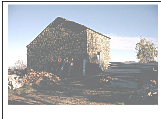
UNITA' EDILIZIA NR. 1