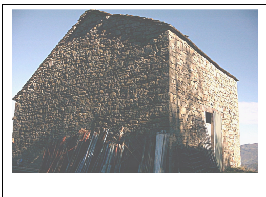
UNITA' EDILIZIA NR. 1