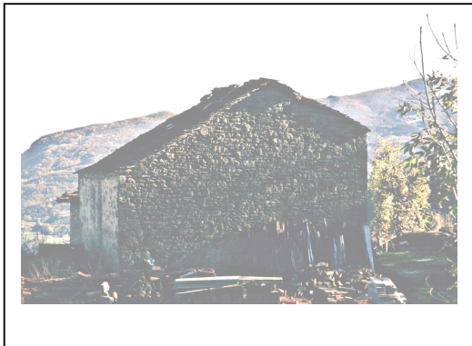
UNITA' EDILIZIA NR. 1